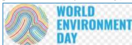
A Környezet(védelmi) Világnap jelképe. Emellett minden évben készül egy kiemelt témakörre utaló jelkép is. E témakörnek 2024-ben a földhasználattal kapcsolatos problémákat, teendőket választották.