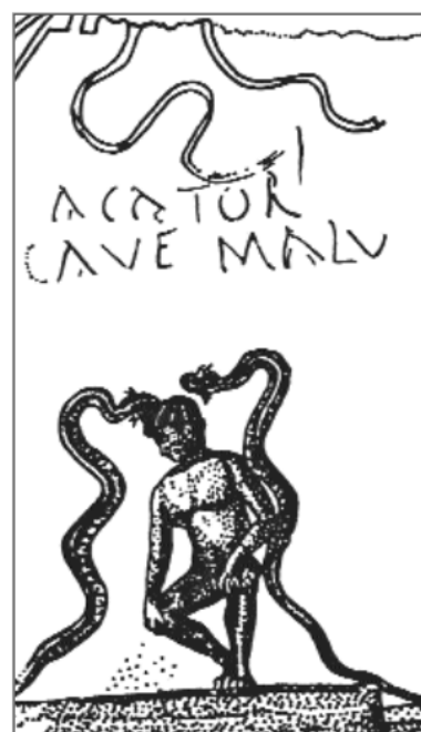
3. kép. Cacator / cave malu. Pompeji feliratos falfestmény

Nem a járókövek elhelyezése és az utcák mosása voltak azonban az egyedüli rendelkezések, amelyekkel a hivatalok az utcák tisztántartásáért küzdöttek. Jogi források szerint a közutak mentén fekvő telkek tulajdonosai kötelesek voltak tisztán tartani az utakat. A háztulajdonosok már csak emiatt a törvényi előírás miatt is – amint azt a nagy mennyiségben megmaradt tiltó táblák is bizonyítják – kintartó, de kilátástalan harcot folytattak egy az egyszerű nép körében elterjedt rossz szokással szemben. A járókelők – bár léteztek nyilvános illemhelyek – zavartalanul végezték kisebb és nagyobb dolgaikat a város kellős közepén a házfalak mellett. Egy pompeii falfestmény in flagranti , meztelenül és guggolva ábrázol egy ilyen elkövetőt (3. kép).