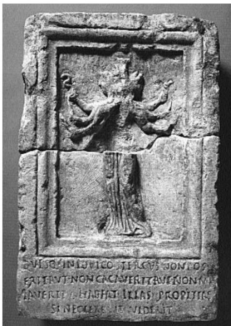
4. kép. Feliratos relief Salonából

szág) városának egy vicusát, azaz utcáját vagy negyedét helyezik a háromalakú útvédélmező és alvilági istennő, Hekaté védelme alá. A kőtáblán az istennőt ábrázoló relief mellett a következő felirat olvasható: „Ők (a három Hekaté – a szerző megjegyzése) legyenek kegyesek mindenkéhez, aki ebben az utcában/negyedben nem rak le szemetet vagy bármiféle módon szükségét nem végzi el! Aki ellenben nem törődik ezzel, az megnézheti magát!” (CIL III 1966).