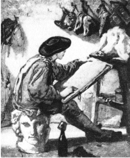
1. kép. Thomas Couture: „A realista” (1865)

von Humboldtval szölvá kerülnünk kell az ókor „túlzott csodálatát” éppúgy, mint „könyvemű lekicsinylését”. 5