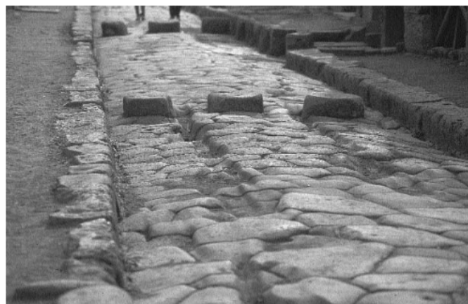
2. kép. „Zebracskók” Pompeiben

mosórendszer áldásos hatásáról írt. Aki Pompeibe látogat, sokkal jobban érti majd, hogy a gyalogosátjárók ottani, illetve másutt is megtalálható „zebracsíkjai” miért emelkednek ki az útfelületből (2. kép). Nemcsak száraz lábbal, hanem lehetőség szerint tisztán is kellett átkelni az utcán.